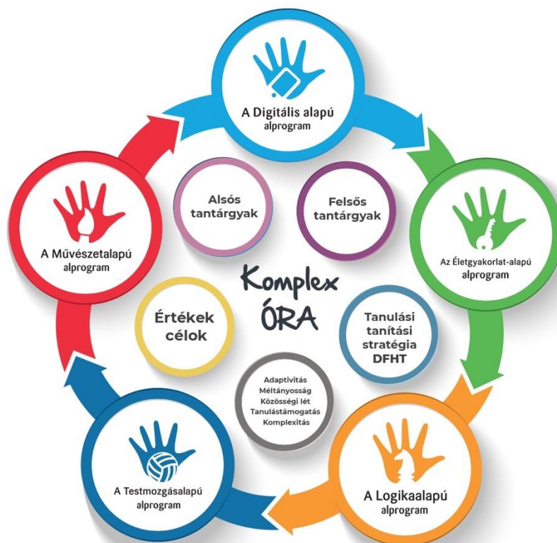
A Komplex órák felépítése